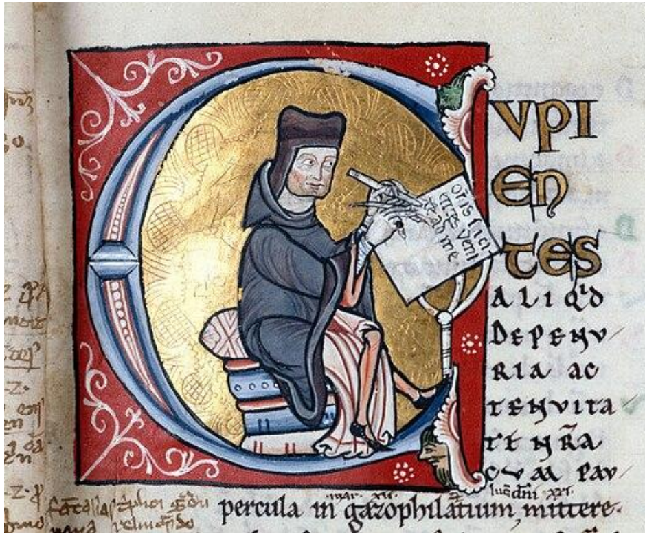
Pietro Lombardo scrive le sue opere (miniatura del sec. XII)