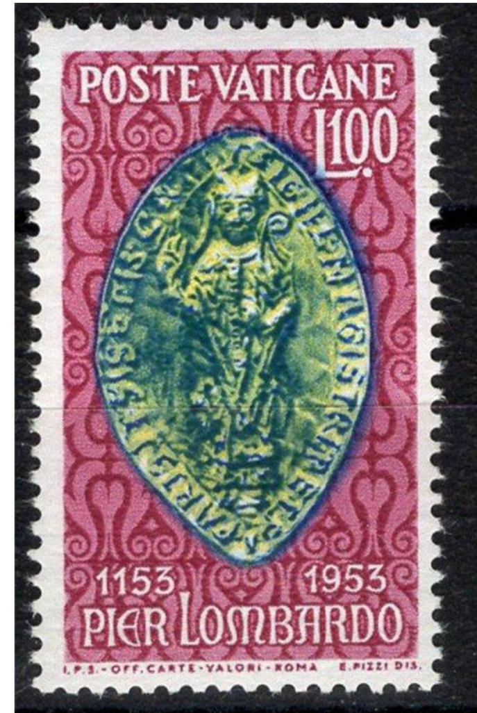
Francobollo commemorativo di Pietro Lombardo nell'VIII centenario della composizione dei «Libri quattuor sententiarum» (Città del Vaticano, 1953)