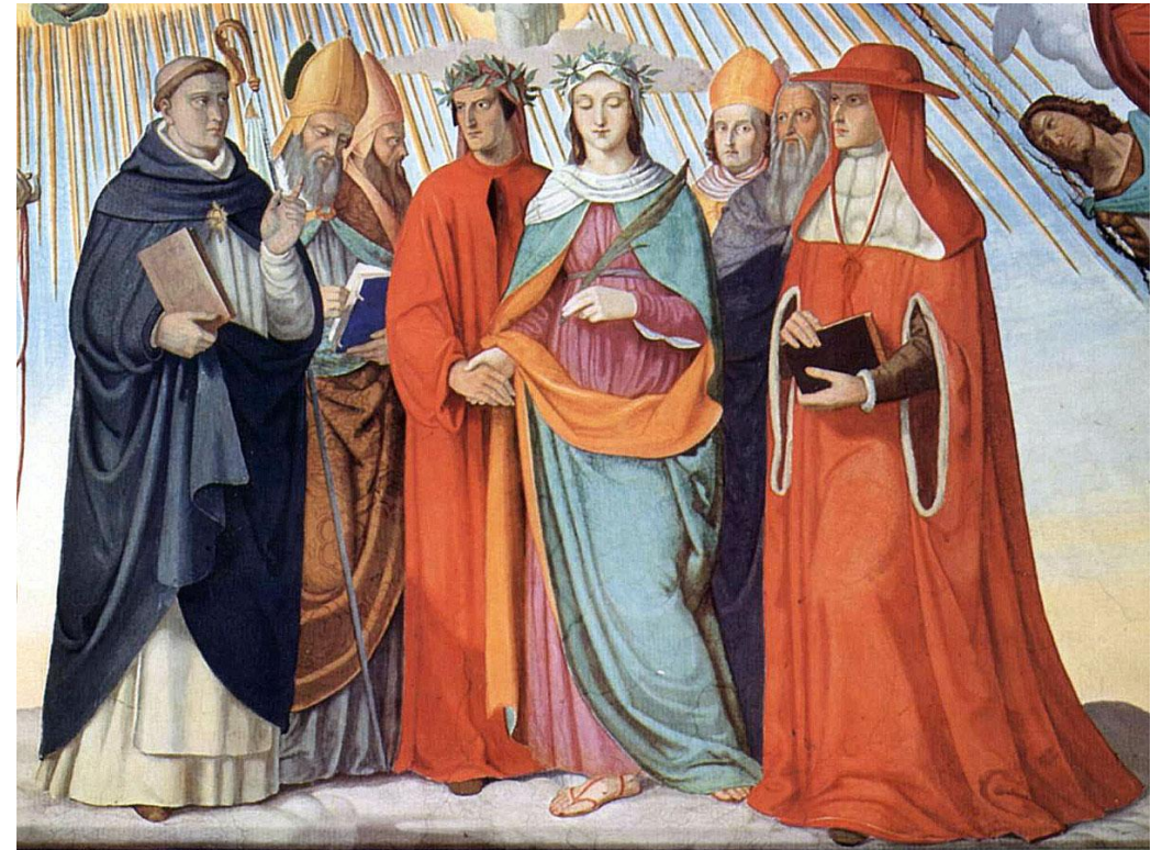
Dante, Beatrice e gli spiriti sapienti nel cielo del Sole (dipinto di Philip Veit)