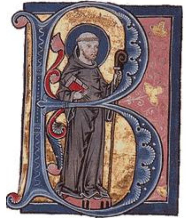
San Bernardo di Chiaravalle (miniatura del sec. XIII)