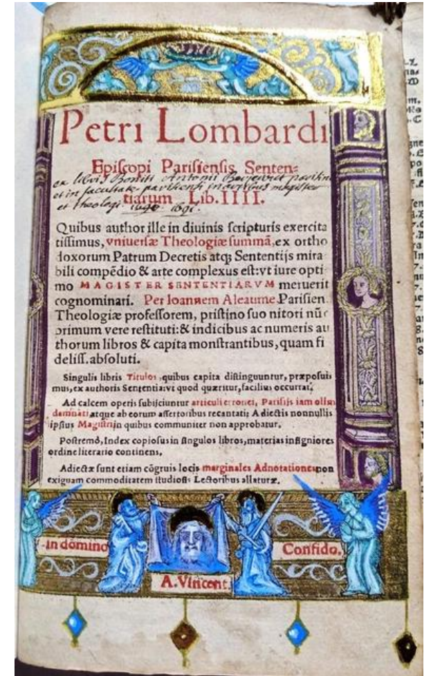
Frontespizio dei «Libri Sententiarum» in un'edizione del 1538