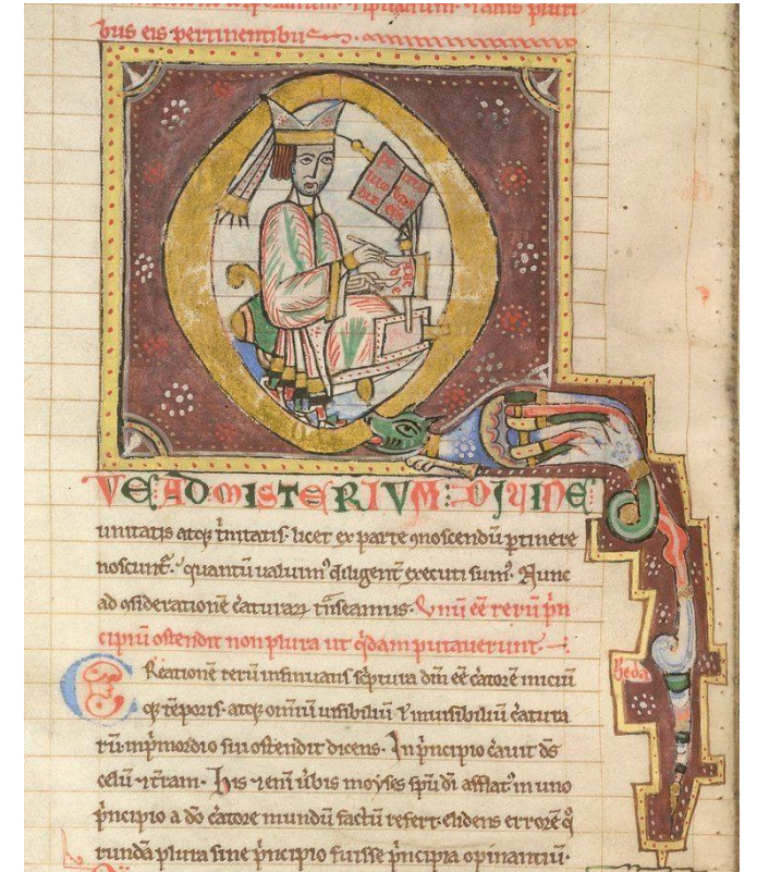
Pietro Lombardo, «Libri sententiarum», miniatura del sec. XII