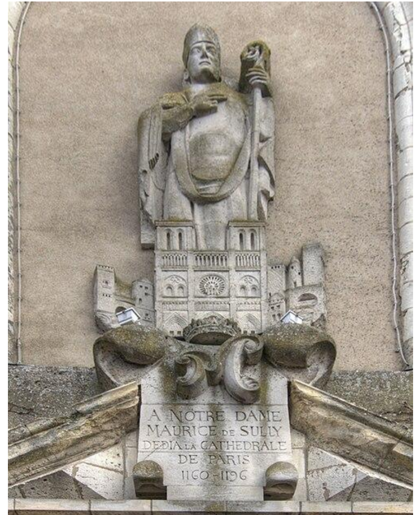
Murice de Sully, successore di Pietro Lombardo nell'episcopato di Parigi