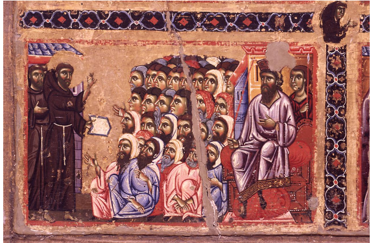
Francesco d'Assisi predica al sultano d'Egitto («Tavola Bardi», 1250)