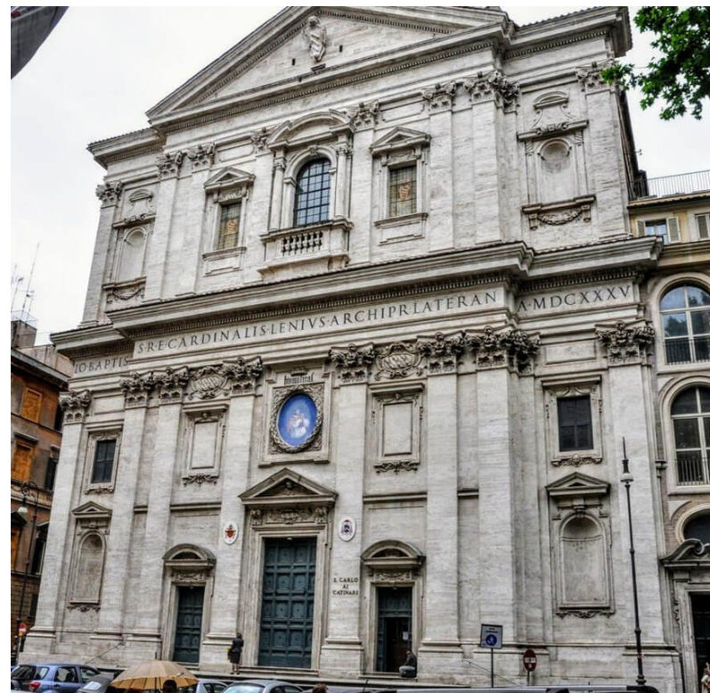
Roma, San Carlo ai Catinari