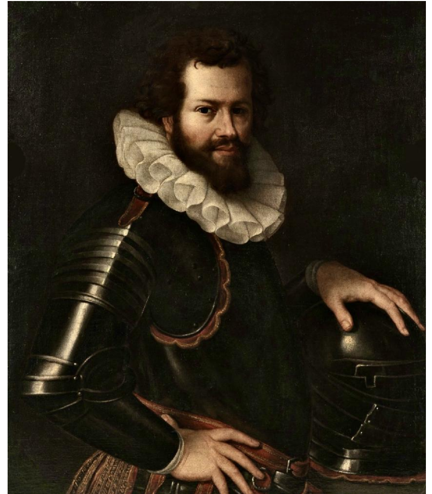
Cesare Aretusi, ritratto di Ranuccio I Farnese (1610)