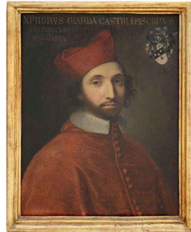
Ritratto del vescovo Cristoforo Giarda