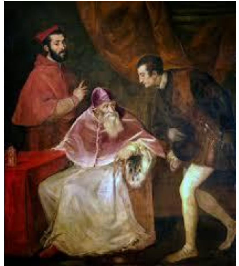
Titiano, Paolo III Farnese e i nipoti Ottavio e Alessandro