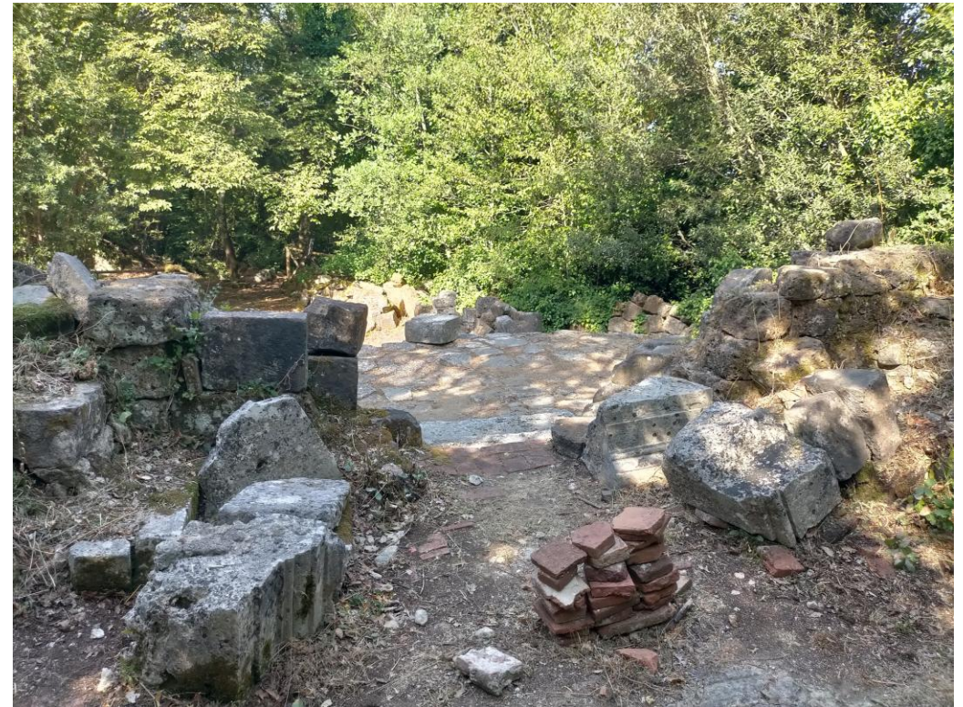
Ischia di Castro (VT), rovine della cattedrale di Castro distrutta nel 1649