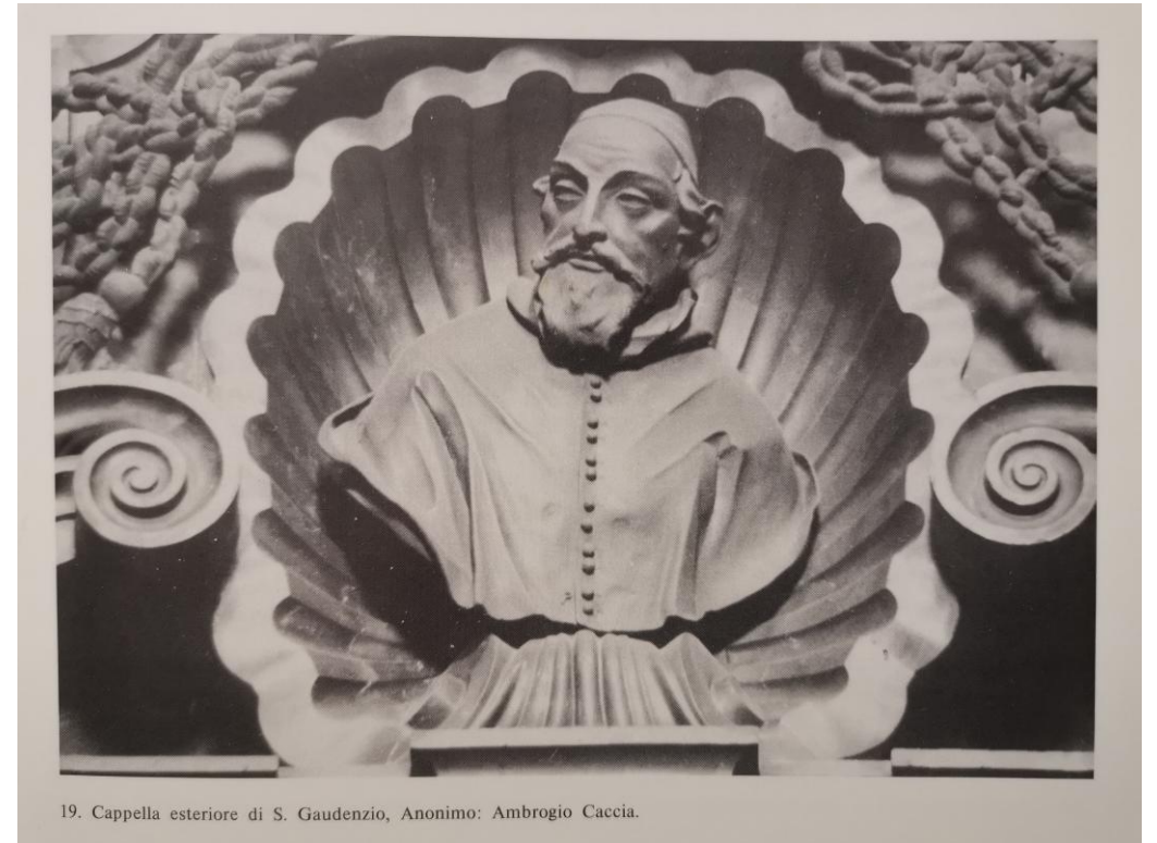
Busto marmoreo di Giovanni Ambrogio Caccia (Giambattista Bianchi?, 1675, Novara, basilica di San Gaudenzio)