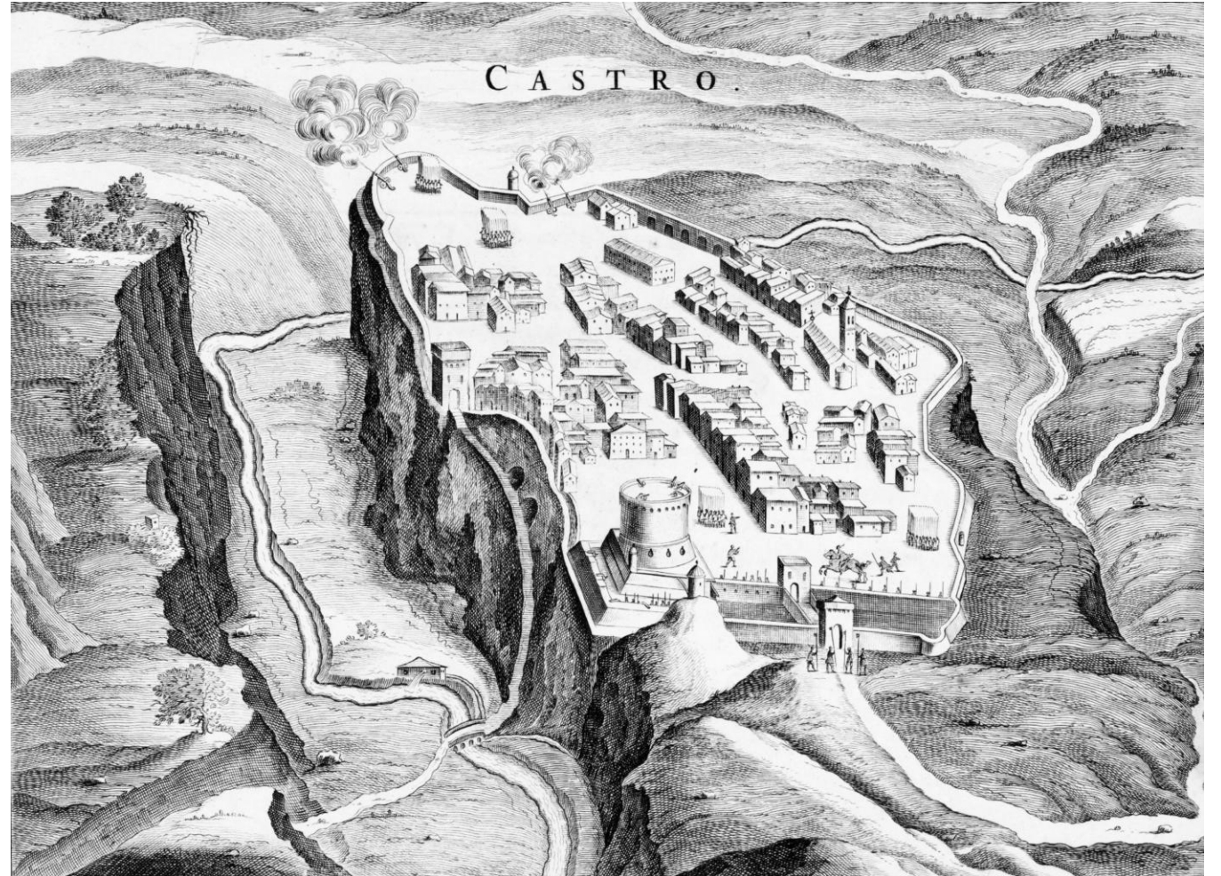
Castro in una incisione di J. de Blaeu, 1663