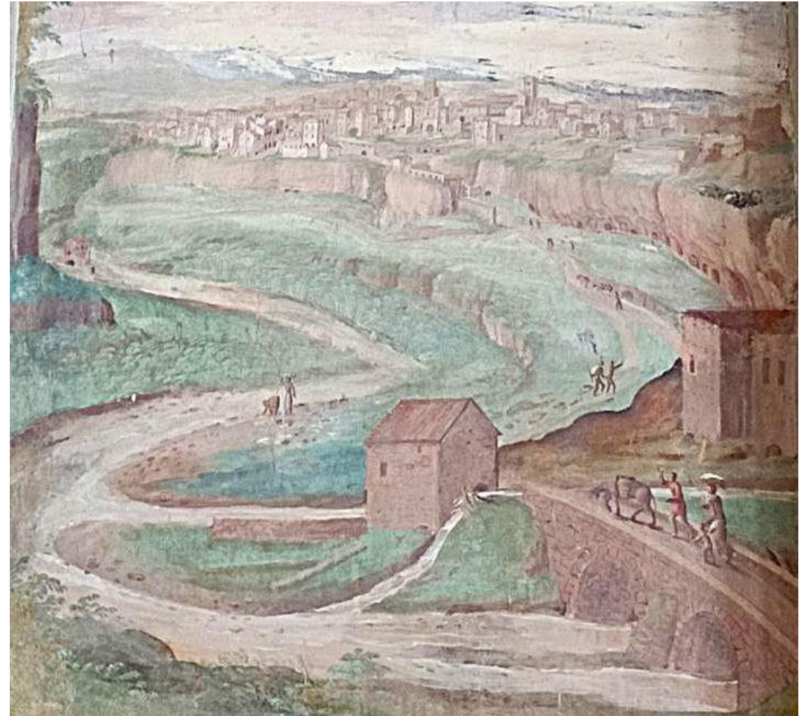
Veduta di Castro nel '500 (Caprarola, palazzo Farnese, affresco)