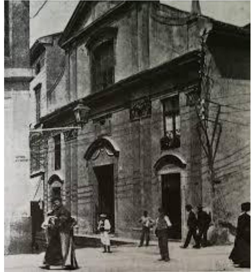
Novara, la chiesa dei SS. Carlo e Ignazio, già annessa al collegio dei gesuiti, demolita agli inizi del '900