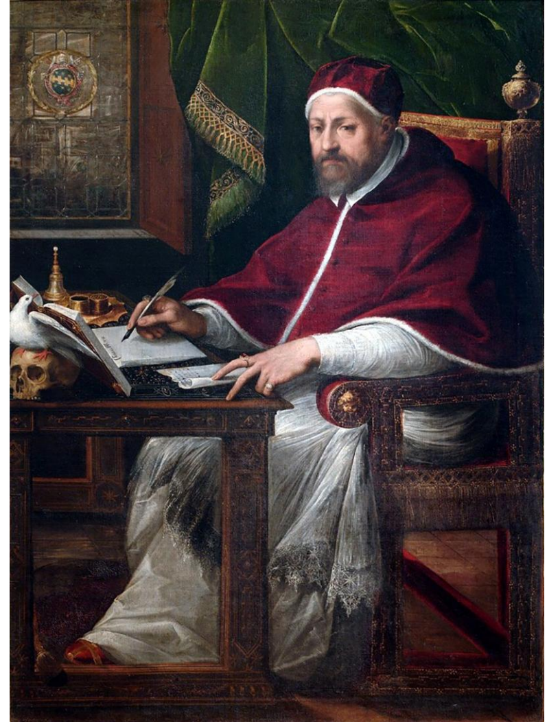
Cavalier d'Arpino, ritratto di papa Clemente VIII Aldobrandini