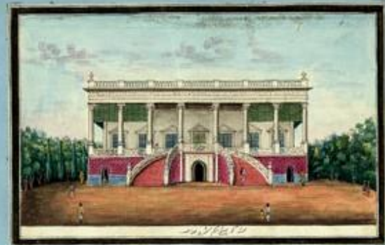
South view of the late Highness the Begum Samru's Palace facing the Chandni Chowk or Principal Street.