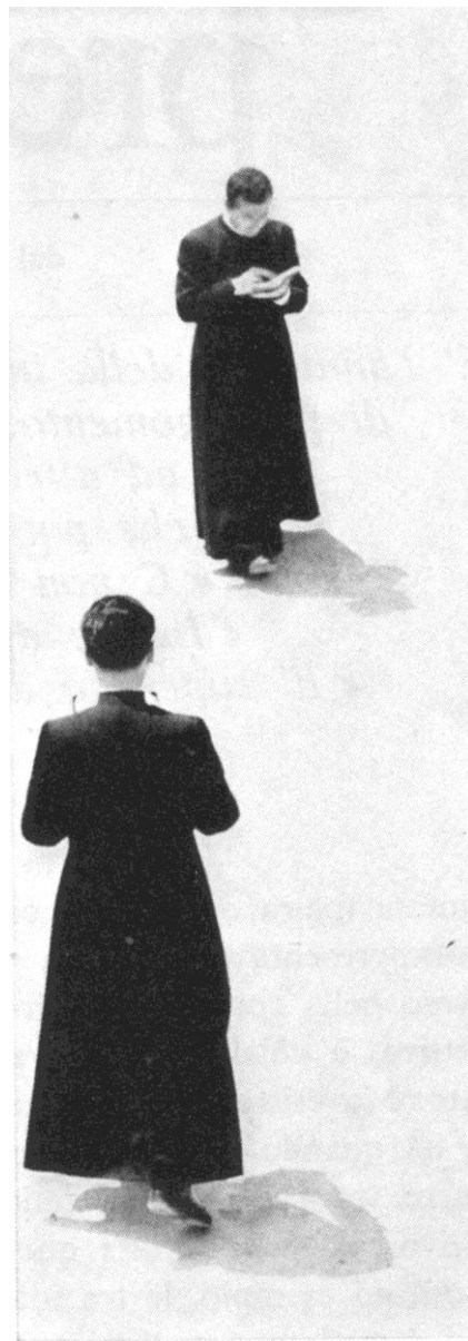
A.A. 2025-26 intervento a cura di Paolo Fratta