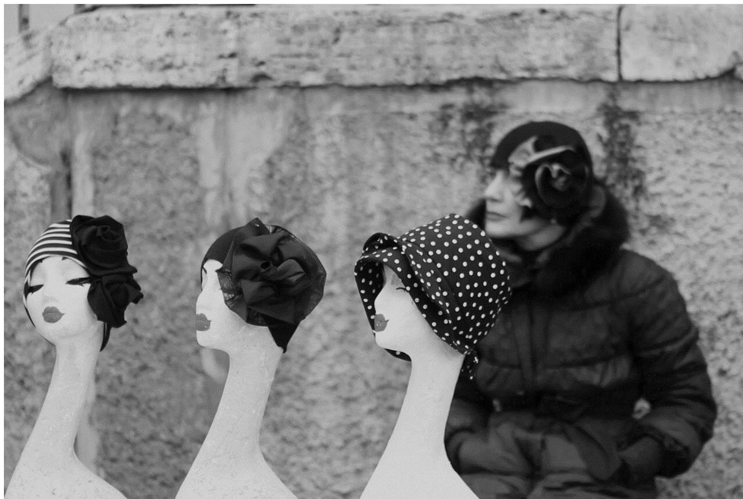
A.A. 2025-26 intervento a cura di Paolo Fratta